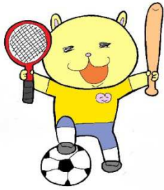
熊谷市マスコット 「ニャオざね」