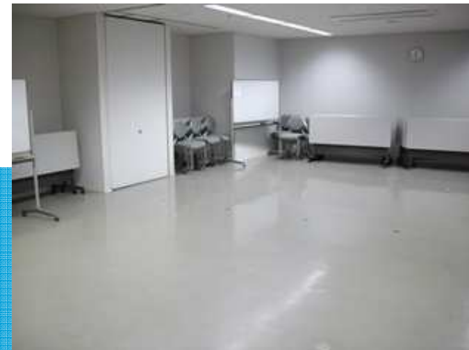
研鑽事業 セミナー会場